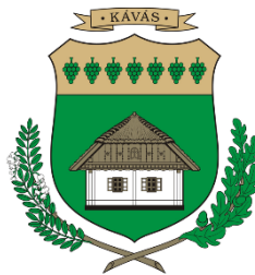
Kávás Község Önkormányzata