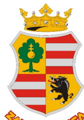
Zalaboldogfa Község Önkormányzata