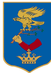
Zalacséb Község Önkormányzata