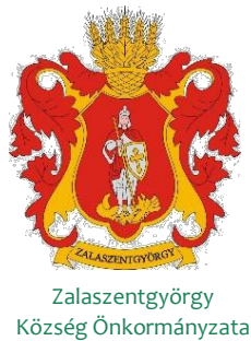
Zalaszentgyörgy Község Önkormányzata